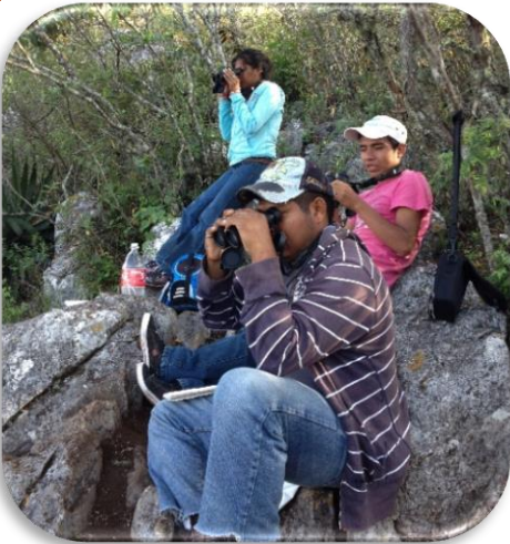
Monitores Comunitarios de la comunidad de Santa María de los Cocos

Los corredores son conexiones del hábitat protegido que ayudan a animales a moverse o migrar por sus actividades.