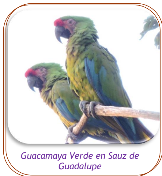
Guacamaya Verde en Sauz de Guadalupe

Ahora, hemos crecido a 5 comunidades dentro de La Reserva de la Biósfera de la Sierra Gorda y se nota el cambio de actitud positiva de la gente sobre conservación en la región.